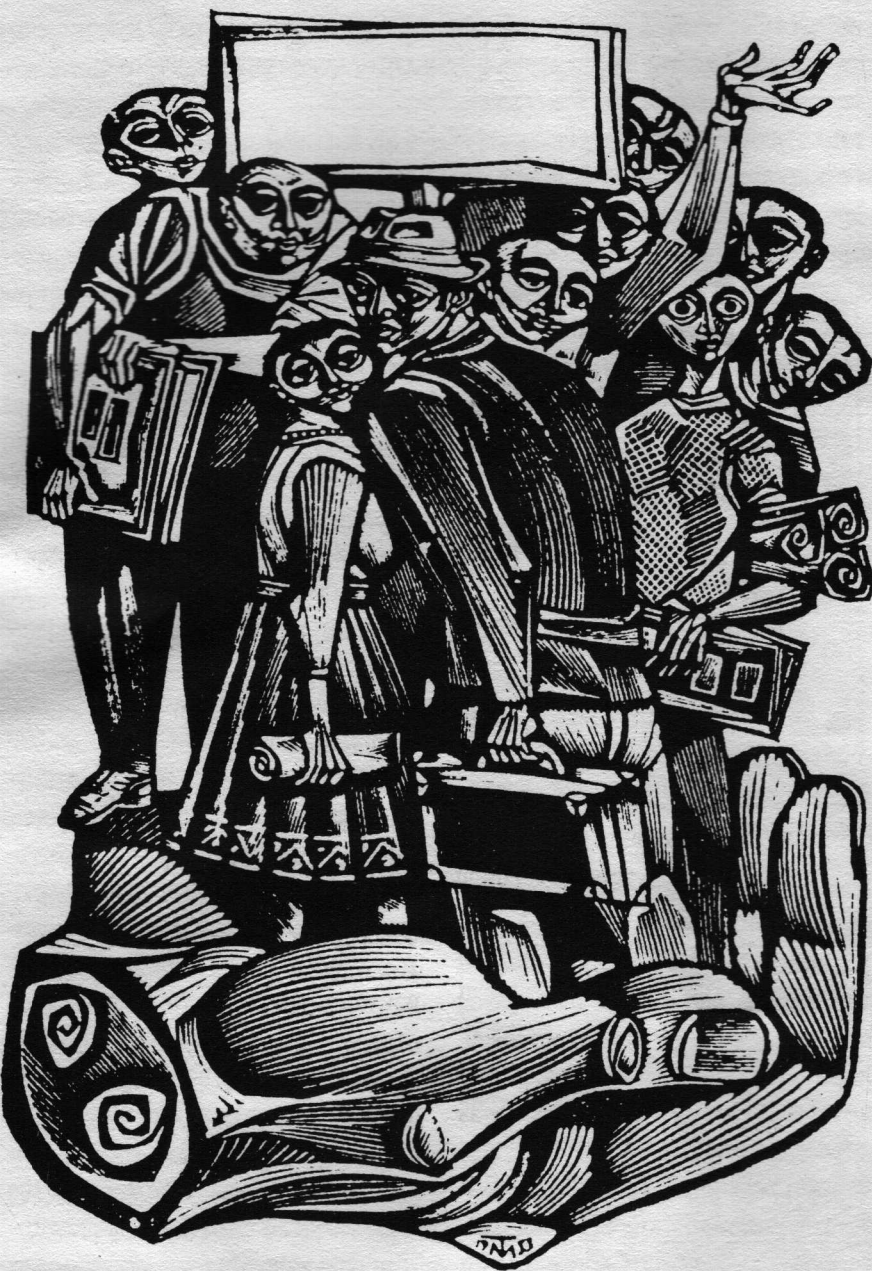
Σχέδιο Tranquillo Marangoni

σης, αλλά παραχωρήθηκε από το λενινιστικό κόμμα που βρισκόταν στην εξουσία, το οποίο, με την ενέργειά του αυτή, διατήρησε την ουσία των προνομίων του. Έτσι η δημοκρατία που εγκαθιδρύθηκε στις επιχειρήσεις μπορεί το πολύ πολύ να θεωρηθεί σαν μια μορφή συνδιαχείρισης μαζί με το Κράτος και με την Ένωση των κομμουνιστών. Χωρίς να μπούμε σε λεπτομέρειες, μπορούμε να παρατηρήσουμε ότι οι δυσκολίες, δηλαδή οι αντιφάσεις που συναντώνται στο ιδιόρρυθμο και νό-