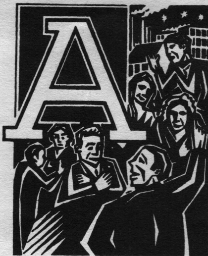
Σχέδιο Clifford Harper

νία η επιθετικότητα θα περιοριζόταν αυτόματα. Από την άλλη μεριά η ισονομία συνεπάγεται ότι κανείς, τουλάχιστον θεωρητικά, δεν μπορεί να κυριαρχεί πάνω σε κάποιον άλλον, γιατί, σύμφωνα με τη θεμελιώδη παρατήρηση του Ρουσσώ, ο κα-