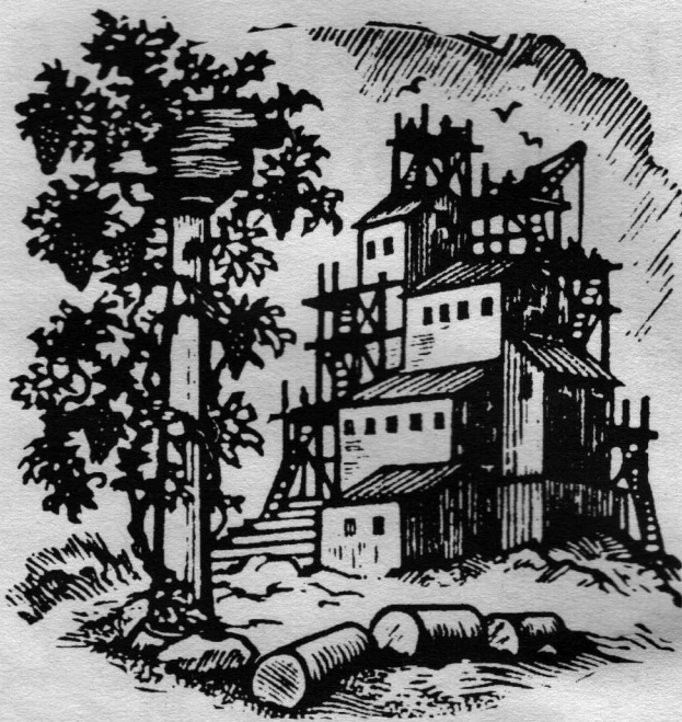
Σχέδιο Thijs Mauve

Σ' αυτά τα τέσσερα σημεία έχω φτάσει, απ' όσα γνωρίζω για την πραγματική ζωή των Κομμουνιστικών κοινοτήτων, όπως έχει γραφτεί από Ρώσους και Δυτικοευρωπαίους που δεν είχαν θεωρητικές αντιλήψεις, δεν προώθησαν θεωρητικές απόψεις, απλώς έγραψαν ή μου είπαν προφορικά τι έζησαν. Η δυστυχία, η ανία και η συνακόλουθη αύξηση του πνεύματος ραδιουργίας για εξουσία, ήταν πάντα οι δύο κυριότεροι λόγοι της ανεπιτυχίας.