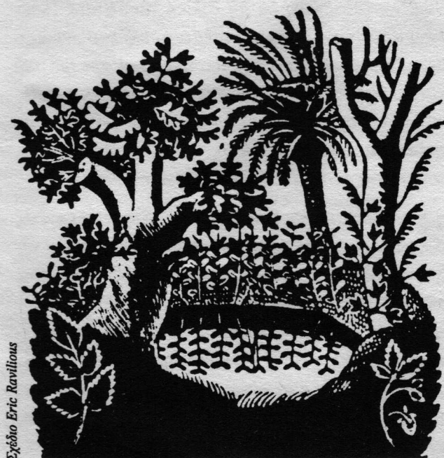
Σχέδιο Eric Ravillious

Η επόμενη μεγάλη δυσκολία είναι η εξής: Δεν ήμαστε ιθαγενείς ανέγγιχτοι από τον πολιτισμό, που μπορούν να ξεκινήσουν μια νομαδική ζωή με καλύβες και βέλη. Ακόμη κι αν δεν υπήρχαν νόμοι για το κυνήγι, θα έπρεπε να νοιαζόμαστε –η πλειοψηφία, τουλάχιστον– για κάποιες ανέσεις και για κάποια καλύτερα κίνητρα για υψηλότερη ποιότητα ζωής από μια σταγόνα αλκοόλ που μας φέρνουν οι έμποροι σε αντάλλαγμα της γούνας. Αλλά στις περισσότερες περιπτώσεις, μια Κομμουνιστική κοινότητα είναι αναγκασμένη να αρχίσει με ακόμη λιγότερα, καθώς είναι επιβαρυνμένη με το χρέος για τη γη στην οποία έχει εγκατασταθεί και είναι μεγάλη ενόχληση για τους ιδιοκτήτες της γύρω γης και των βιομηχανιών. Συνήθως ξεκινά με ένα μεγάλο χρέος, ενώ οφείλει να αρχίζει με δικό της μερίδιο κεφαλαίου που παράχθηκε από την συσσώρευση εργασίας των προηγούμενων γενεών. Έτσι, η συνήθης συνθήκη για κάθε Κομμουνιστική κοινότητα που έχει μέχρι σήμερα επιχειρηθεί, είναι η δυστοχία και ένας τρομερός αγώνας για τις απλές ανάγκες της ζωής, για να μην μιλήσουμε για την πιο πάνω εχθρότητα. Αυτός είναι ο λόγος που δεν θα μπορούσα να επιμείνω πολύ πάνω στην σοφή σας απόφαση, να ξεκινή-