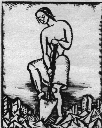
Σχέδιο Ludovic Kozma

φών». Όπως βλέπουμε, ο Κολμ εισάγοντας την έννοια της αδελφότητας στην οικονομία τοποθετείται αποφασιστικά στο ηθικό επίπεδο. Η εισαγωγή αυτή του φαίνεται πάντως αναγκαία, γιατί, σύμφωνα μ' αυτόν «ούτε η Αγορά ούτε το Πλάνο προάγουν τις ωραιότερες ιδιότητες του ανθρώπου». Αντίθετα, δε λειτουργούν παρά μέσω του δολώματος του κέρδους ή της ικανοποίησης του ηγετισμού, πράγμα που οι Κολμ ονομάζει «το κατακάθι των συναισθημάτων». Από το γεγονός αυτό προκύπτει ότι στα δυο αυτά συστήματα, δηλαδή σε όλο σχεδόν τον κόσμο, «εκατομμύρια άνθρωποι περνούν χιλιάδες ώρες χωρίς ομορφιά, καλοσύνη, ελευθερία».