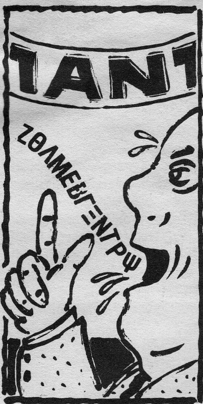
Σχέδιο Λάζαρου Ζήκου

Σε αυτή τη σφοδρή ανακατάταξη του κοινωνικού τοπίου το κράτος επιδιώκει να κατοχυρώσει ένα ασφαλές περιβάλλον για την αδιάτακτη λειτουργία των αγορών, υποστέλλοντας την παρεμβατική δράση που το χαρακτήριζε μεταπολεμικά, στις περισσότερες ευρωπαϊκές χώρες. Ο βαθμός διεθνοποίησης της οικονομίας της αγοράς αποκλείει την άσκηση ανεξάρτητης οικονομικής πολιτικής των εθνικών κυβερνήσεων, υπονομεύοντας την αξιοπιστία της επίσημης πολιτικής. Η απώλεια εμπιστοσύνης στους επαγγελματίες πολιτικούς που εκδηλώνεται ποικιλοτρόπως (αποχή, μείωση του αριθμού των κομματικών μελών –ιδιαίτερα στο κυβερνών κόμμα) προσλαμβάνει το χαρακτήρα μιας γενικευμένης αμφισβήτησης, συνειδητής ή υποσυνείδητης, ουσιαστών θεσμών, ζωτικής σημασίας, που αποτελούν τους παραδοσιακούς φορείς της αντιπροσωπευτικής δημο-