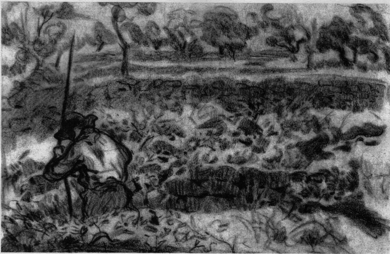
Σχέδιο Pablo Picasso

έχουν ανάγκη από σκοτεινές περιοχές που να χρησιμεύουν για καταφύγια. Η θεσμοποίηση, παράγοντας τη διαφάνεια, μοιάζει να εκθέτει τους εργαζόμενους σε έναν δυνητικό τουλάχιστον έλεγχο.