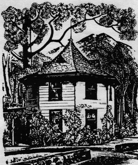
Σχέδιο Malette Dean

κτεταμένη γεωργία, με όλες τις ταλαιπωρίες, τα ατυχήματα, τα μειονεκτήματα και το ποσοστό σκληρής δουλειάς που απαιτεί, η οποία είναι πολύ συχνά ανώτερη των δυνάμεων των μελών της κοινότητας,